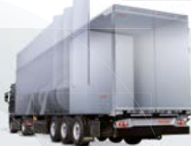
Прицепыс Kögel бортовой платформой

Продукты компании Kögel для транспортно-экспедиторской отрасли