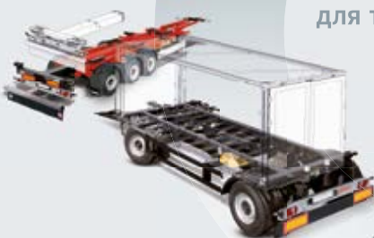
Системы смена кузовов Kögel

Kögel со своим многообразием продуктов и комплектующих реализует для крепления грузов свою инновационную технологию собственной разработки с учётом индивидуальных особенностей адаптированных для каждого потребителя.