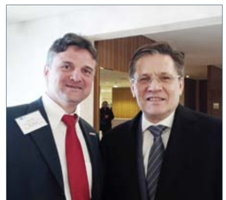
Алексей Лихачев, первый заместитель министра по развитию экономики в РФ и Фолькер Зайц.