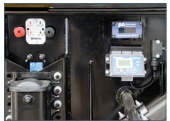
..... Unité de commande bien structurée