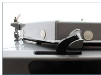
..... Crochet de verrouillage