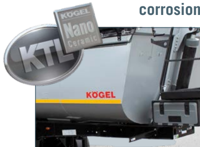
..... Protection contre la corrosion