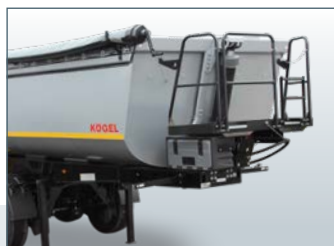
..... Plateforme de commande