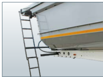
..... Dispositif d'aide à la montée extensible (en option)