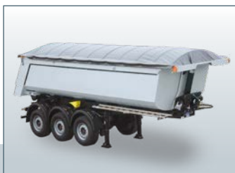
..... Capote de benne électrique (en option)