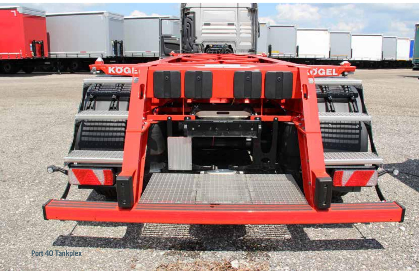
Port 40 Tankplex