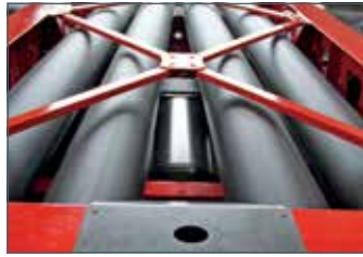
Uložení pro trubky na hadice