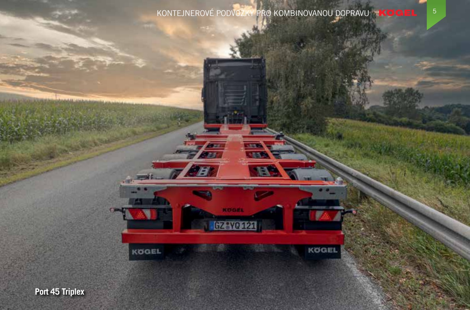
Port 45 Triplex